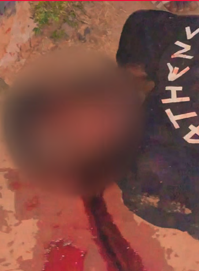
Un jeune tué à Ziguinchor d'une balle en pleine tête

Le recensement et les collectes effectués et documentés par la « Commission Santé » de notre parti fait état d'un bilan malheureusement macabre.