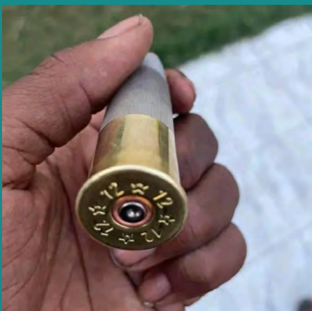
Cartouche de balle en caoutchouc utilisée contre les manifestants