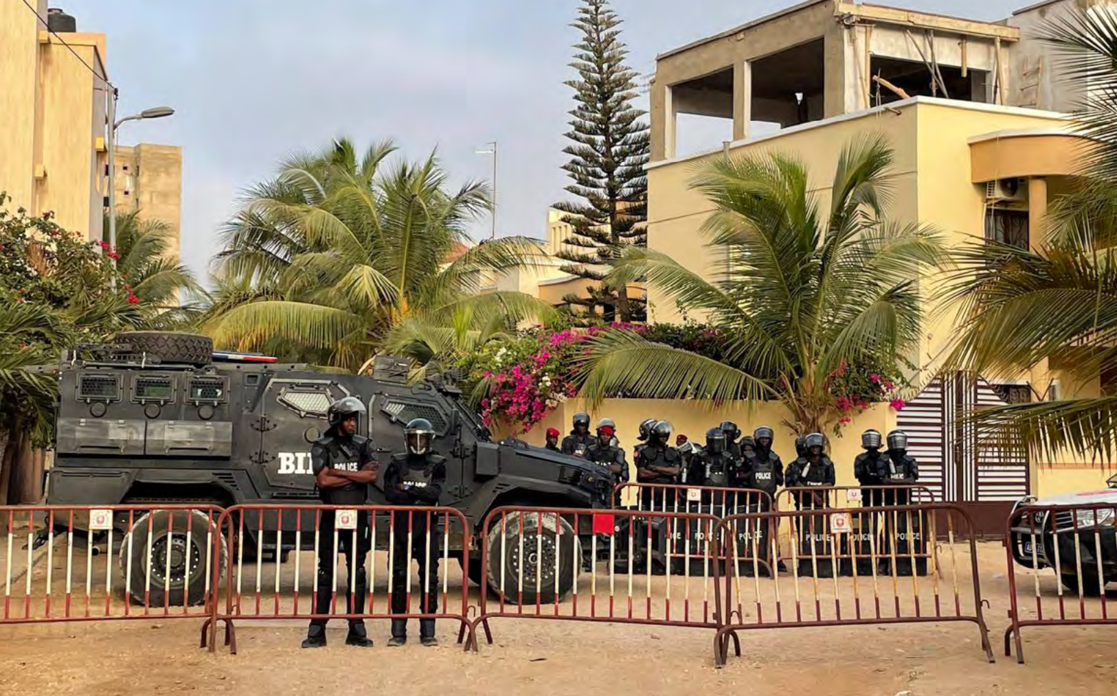
Image du blocus du domicile de Ousmane Sonko

Aussi, nous exigeons l'ouverture d'une enquête internationale, indépendante, sous l'égide de l'ONU et de l'Union Africaine, pour faire confirmer ou infirmer nos développements ci-dessus, situer les responsabilités et permettre à la justice, nationale ou internationale d'élucider puis de juger et sanctionner :