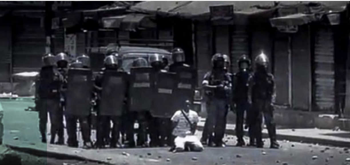
Capture d'écran d'un jeune utilisé comme bouclier humain par les gendarmes

La décision du tribunal de me condamner, pour une infraction non invoquée ni dans la plainte ni dans l'ordonnance de mise en accusation, est une commande politique. Celle-ci vient parachever le complot laborieusement concocté par le pouvoir exécutif sénégalais contre un opposant en vue d'empêcher ce dernier de participer à l'élection présidentielle de 2024.