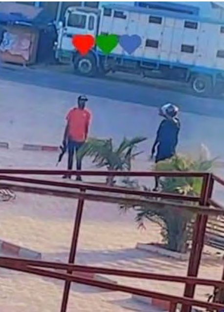
Capture d'écran d'un milicien armé de fusil d'assaut, opérant aux côtés de la police

Par suite des nombreux morts et blessés, certains graves, au sujet desquels des députés à l'Assemblée nationale ont interpellé le Premier Ministre dans le cadre de questions orales au gouvernement, ce dernier a refusé de répondre aux questions suivantes :